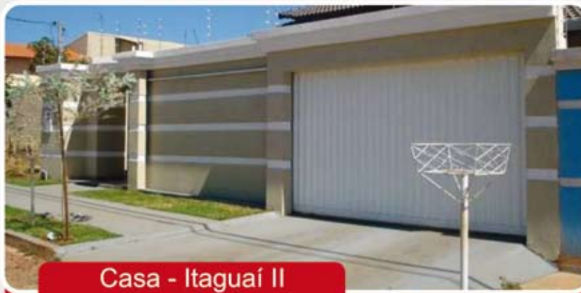
Casa - Itaguaí II

Casa - 3/4 sendo 2 suite, 2 WC, Sala, Copa, Cozinha, Área de serviços, portão eletrônico, Churrasqueira, lavanderia, acabamento de primeira e garagem para 4 carros.