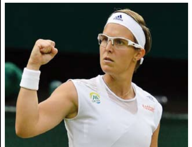
Kirsten Flipke garantiu sua primeira semifinal em Grand Slams ao superar a tcheca Petra Kvitová

Agora, ela lutará por uma vaga na decisão de Wimbledon contra a francesa Marion Bartoli (15ª), amanhã (4).