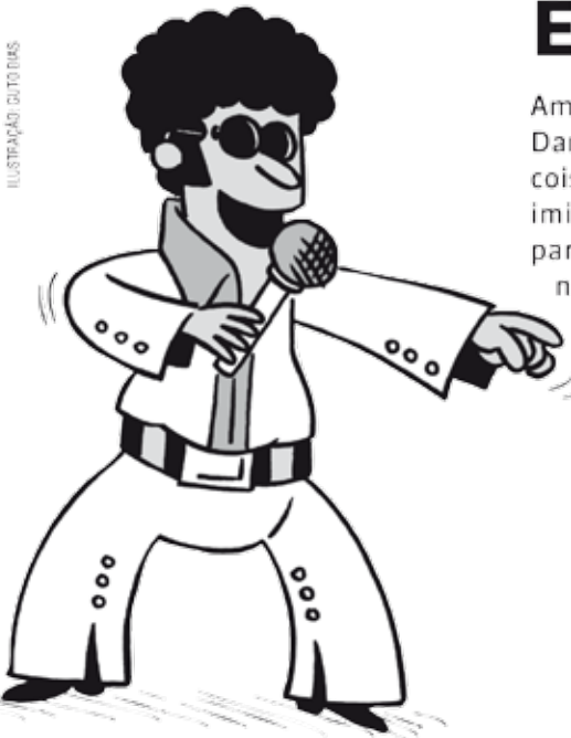
ILUSTRAÇÃO: GUTO RUAS

Resolva o passatempo, preenchendo o quadro. Coloque S (sim) em todas as afirmações e complete com N (não) os quadrinhos restantes (veja o exemplo). Para isso, use sempre a lógica, a partir das dicas.