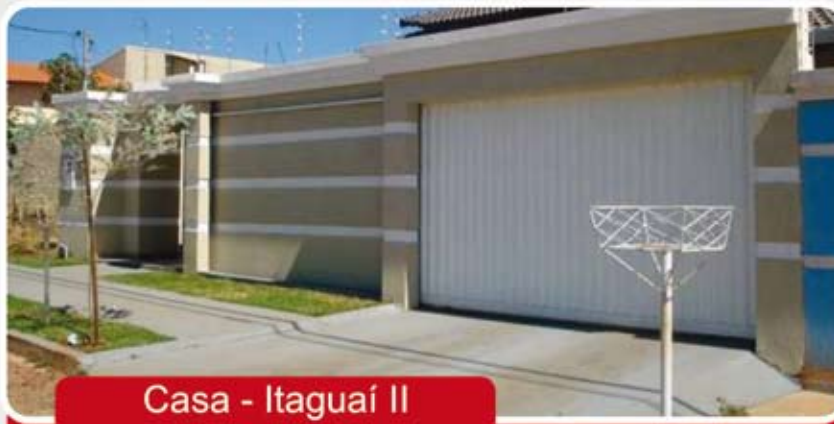
Casa - Itaguaí II

Casa - 3/4 sendo 2 suíte, 2 WC, Sala, Copa, Cozinha, Área de serviços, portão eletrônico, Churrasqueira, lavanderia, acabamento de primeira e garagem para 4 carros.