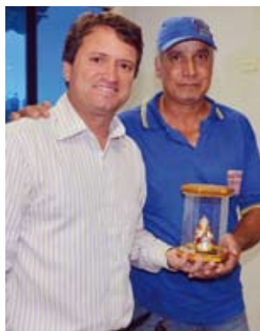
prefeito Evandro Magal.

De acordo com o prefeito, as principais obras do governo municipal são na área de infraestrutura. “Nós estabelecemos que a saúde será o nosso principal foco durante esta administração. Mas em segundo lugar está a realização de obras importantes, como pavimentação de vias, construção de grandes avenidas, galerias pluviais, postos de saúde, escolas, pistas de cooper e academias ao ar livre. Nosso governo será marcado por grandes obras”, disse o