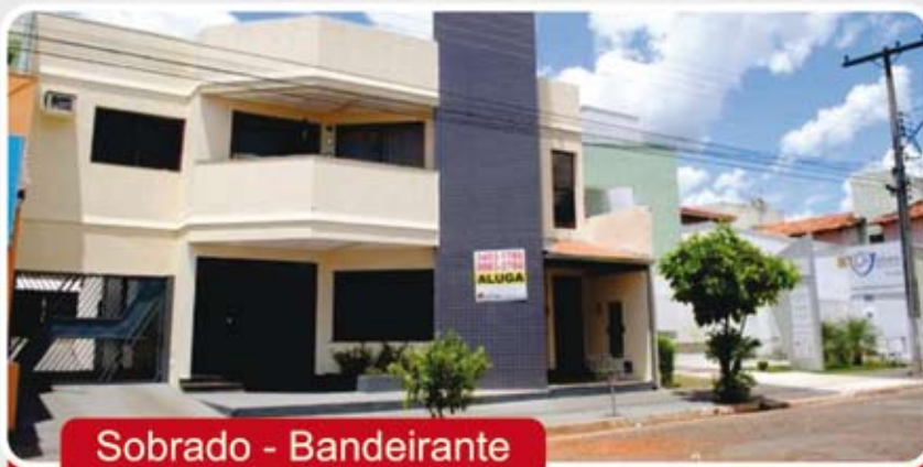
Sobrado - Bandeirante

Excelente Sobrado Comercial e Residencial - área livre do terreno 420m². Área construída aproximadamente 450m². Sala de TV, ampla cozinha com armários, armários em todos os quartos, área para garagem ou ampliação.