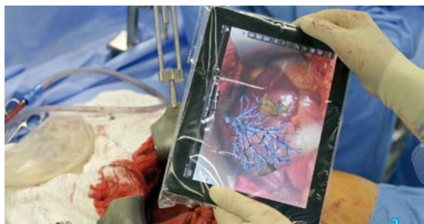
Foto Legenda Cirurgia feita com tablet usa realidade aumentada para reconstruir órgão