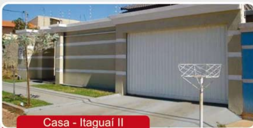
Casa - Itaguaí II

Casa - 3/4 sendo 2 suite, 2 WC, Sala, Copa, Cozinha, Área de serviços, portão eletrônico, Churrasqueira, lavanderia, acabamento de primeira e garagem para 4 carros.