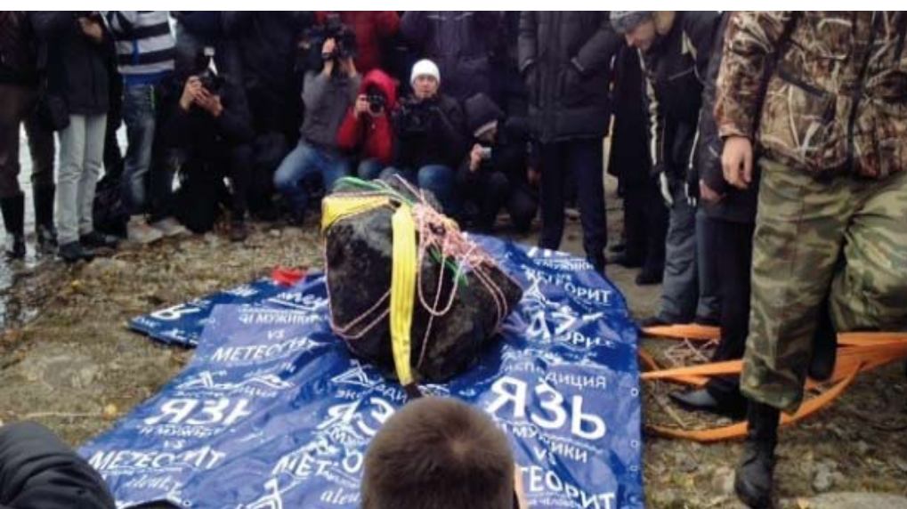
Foto Legenda. Mergulhadores retiram pedaço de meteorito de lago russo. Página 2.