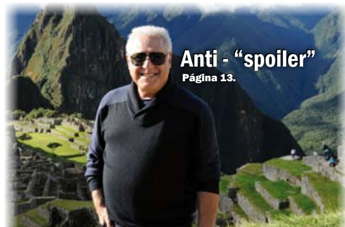
Anti - "spoiler" Página 13.

DIÁRIO - R$ 0,50 - Ano 8 - Número - 2.041 - Quinta-Feira, 17/10/2013.