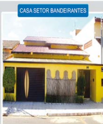
CASA SETOR BANDEIRANTES

Aptº mobiliado, 3 quartos sendo 1 suíte, sala/copa, cozinha, banheiro social, dependência para empregada, área de serviço, sacada, garagem, área de lazer com piscinas, sauna e salão de festas, ótima localização no Centro da cidade.