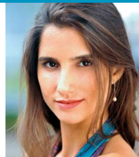
Canal ZAP Máquina do Tempo Página 12.