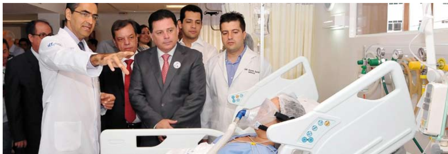
Governador inaugura nova UTI do HGG e entrega viaturas ao Hemocentro para coleta de sangue. Página 5.

Estado. Ala antiga com 10 leitos, foi desativada e a nova, além de ter sido equipada conta com 29 leitos.