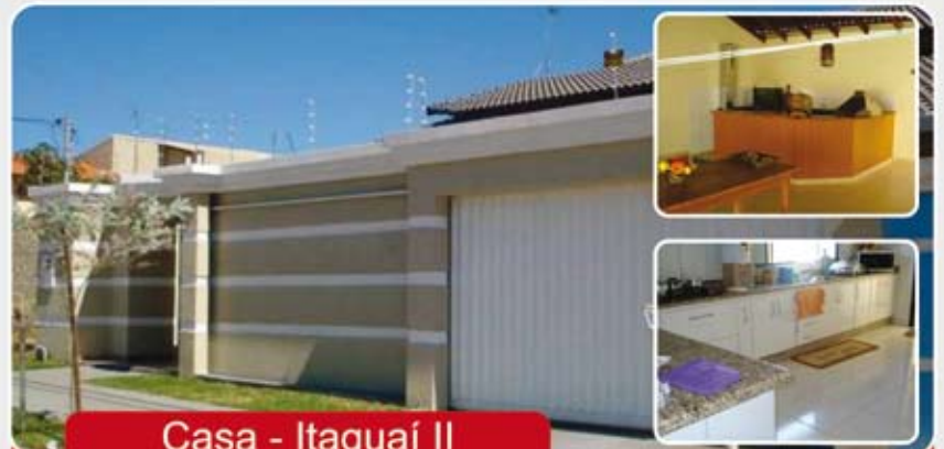
Casa - Itaguaí II

Casa - 3/4 sendo 2 suíte, 2 WC, Sala, Copa, Cozinha, Área de serviços, portão eletrônico, Churrasqueira, lavanderia, acabamento de primeira e garagem para 4 carros.