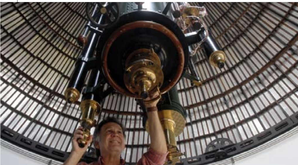
Foto Legenda. Observatório Nacional promove visitas ao telescópio mais antigo do país. Página 2.