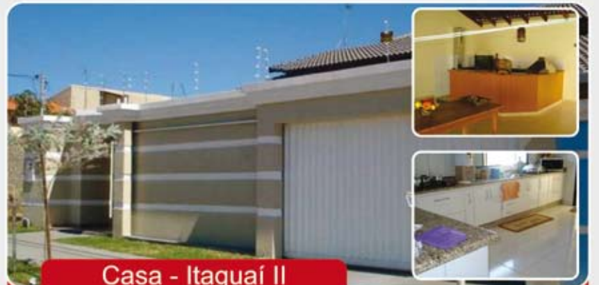
Casa - Itaguaí II

Casa - 3/4 sendo 2 suíte, 2 WC, Sala, Copa, Cozinha, Área de serviços, portão eletrônico, Churrasqueira, lavanderia, acabamento de primeira e garagem para 4 carros.