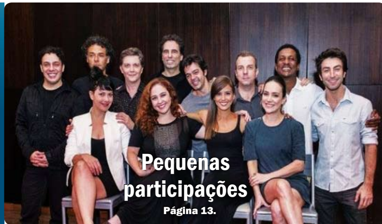
Pequenas participações Página 13.

DIÁRIO - R$ 0,50 - Ano 8 - Número - 2.063 - Sexta-Feira, 22/11/2013.