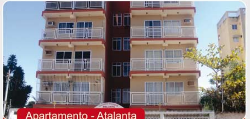
Apartamento - Atalanta

Apartamento - Cobertura, dúplex 3 quartos, sendo 2 suítes, 4 banheiros, 2 salas, cozinha, área de serviço, sauna, deck, localizado no centro de Caldas Novas.