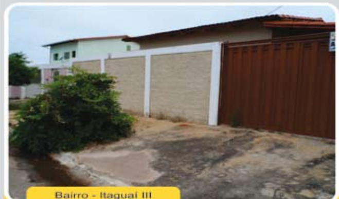
Bairro - Itaguaí III

Casa de 3/4 sendo 01 suíte, 01 banheiro social, sala, cozinha, área de serviço, varanda, dispensa, garagem e um amplo quintal. Ótima localização! R$ 130 mil oportunidade única.