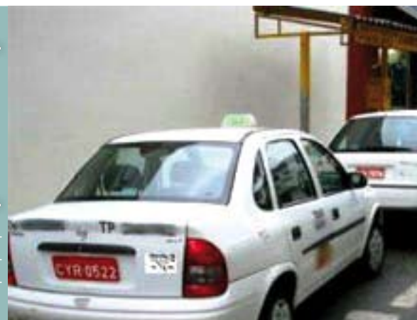
Foto legenda. Violência conta a mulher. Página 12.

O Ministério Público de Goiás investiga irregularidades no processo de licitação de permissionários de táxi em Goiânia, aberto em julho... Página 3.