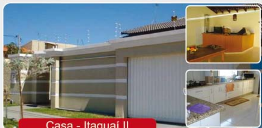
Casa - Itaguaí II

Casa - 3/4 sendo 2 suíte, 2 WC, Sala, Copa, Cozinha, Área de serviços, portão eletrônico, Churrasqueira, lavanderia, acabamento de primeira e garagem para 4 carros.