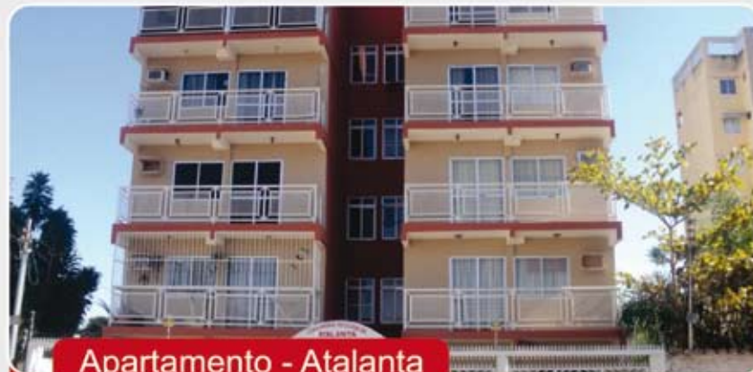
Apartamento - Atalanta

Apartamento - Cobertura, dúplex 3 quartos, sendo 2 suítes, 4 banheiros, 2 salas, cozinha, área de serviço, sauna, deck, localizado no centro de Caldas Novas.