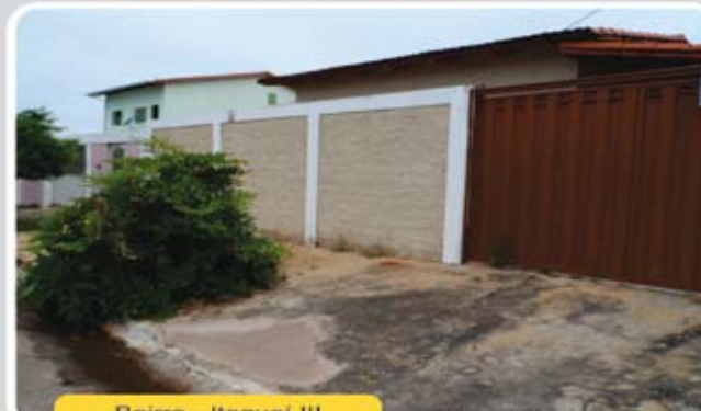
Bairro - Itaguaí III

Casa de 3/4 sendo 01 suíte, 01 banheiro social, sala, cozinha, área de serviço, varanda, dispensa, garagem e um amplo quintal. Ótima localização! R$ 130 mil oportunidade única.