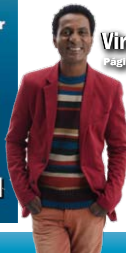
Vira vira Página 13.

DIÁRIO - R$ 0,50 - Ano 9 - Número - 2.147 - Segunda-Feira, 10/03/2014.