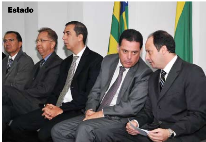
Marconi lança programa que repassa recurso direto para reformar delegacias e quartéis. Página 5.

Aluna que mentiu sobre conclusão de ensino médio terá de deixar universidade. Página 4.