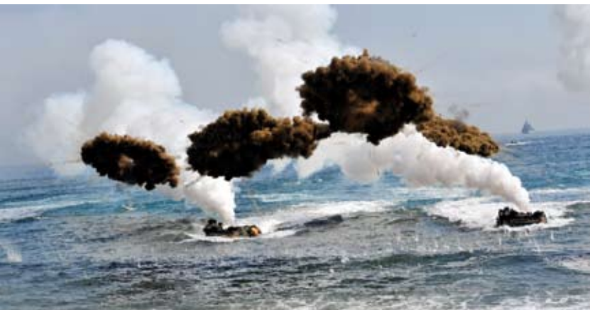
Coreia do Sul e Coreia do Norte disparam fogo real de artilharia ao mar na fronteira. Página 2.