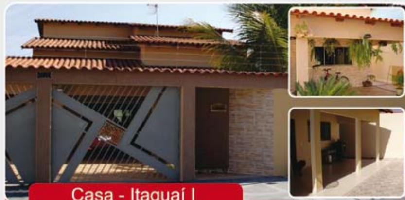
Casa - Itaguaí I

Aceita Imóvel de menor valor, carro e estudo propostas! Reservatório de água quente, garagem para 4 carros, armários embutido da cozinha e banheiros, box nos banheiros.