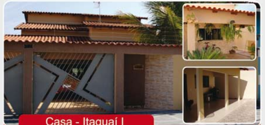
Casa - Itaguaí I

Aceita Imóvel de menor valor, carro e estudo propostas! Reservatório de água quente, garagem para 4 carros, armários embutido da cozinha e banheiros, box nos banheiros.