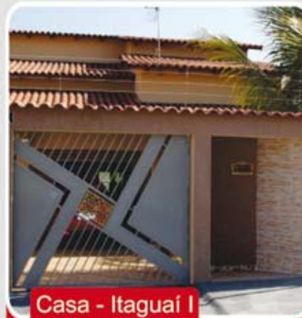
Casa - Itaguaí I

Aceita Imóvel de menor valor, carro e estudo propostas! Reservatório de água quente, garagem para 4 carros, armarios embutido da cozinha e banheiros, box nos banheiros.