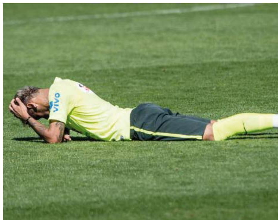
Atacante minimizou pressão por jogar Mundial no Brasil e diz que se mentaliza jogando contra seus amigos

“Estou bem, já estou recuperado”, assegurou. “E, na parte emocional, também ninguém do grupo está com problema, todos estão bem. O jogo contra o Chile foi emocionante. Eu fiquei muito emocionado, todos ficaram. Cada um tem sua emoção, mas estamos todos bem, preparados para enfrentar a seleção da Colômbia e, se Deus quiser, passar de fase”, concluiu o camisa 10, antes de almoçar rapidamente e se mudar de casa. Ainda nesta quarta-feira, a delegação segue para Fortaleza, palco das quartas de final.