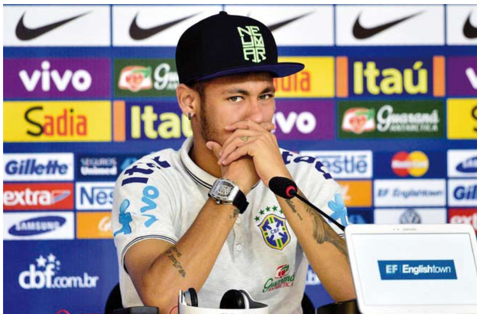
Neymar esconde a boca durante a entrevista coletiva na Granja Comary

“É claro que existe pressão, mas eu tiro isso lembrando que jogar uma Copa é um sonho para mim. Eu sempre busquei isso, desde criança. Quando vi o Ronaldo, com tope, fazendo gol, dizia que queria jogar uma Copa. Hoje, estou disputando um