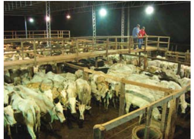
Leilão de gado realizado em Morrinhos