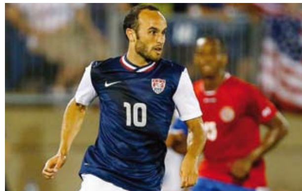
Acompanhando do lado de fora por opção técnica, Donovan não aprovou desempenho dos EUA

Maior referência do futebol norte-americano, o meia Landon Donovan, do Los Angeles Galaxy, disparou contra o desempenho de seus antigos companheiros na Copa do Mundo de 2014. O jogador de 32 anos acabou surpreendentemente ficando de fora do Mundial, em uma polêmica decisão do técnico Jurgen Klinsmann.