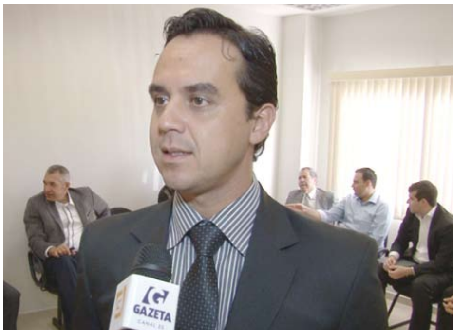
Reunião na OAB Caldas Novas

Essa integração visa melhorar o serviço público, uma vez que para entrar com pedido de divórcio, ou fazer inventários, é necessário o acompanhamento de um advogado no cartório. "Ficamos felizes com a grande presença de advogados, empresários do setor imobiliário e tabeliães, que atenderam nosso cha-