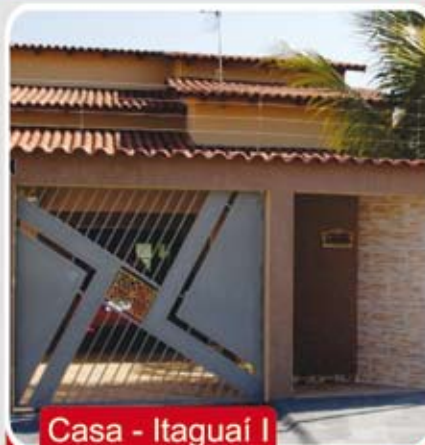
Casa - Itaguaí I

Aceita Imóvel de menor valor, carro e estudo propostas! Reservatório de água quente, garagem para 4 carros, armários embutido da cozinha e banheiros, box nos banheiros.