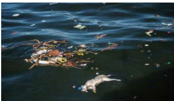
A atual condição da água na Baía de Guanabara foi criticada por grande parte dos atletas

O evento-teste no Rio de Janeiro atraiu mais de 20 medalhistas, entre eles Robert Scheidt, maior atleta olímpico da história do Brasil, com dois ouros, duas pratas e um bronze. Durante a semana de competição, as 10 classes que integram o programa dos Jogos estarão nas águas da Baía