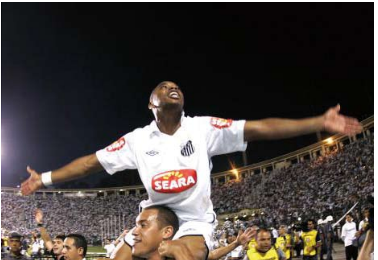
Robinho teve sua última passagem pelo Santos em 2010 e está agora perto de retornar

Outro clube interessado por Robinho no futebol brasileiro era o Flamengo, que vinha buscando parceiros para bancar o salário pedido pelo atacante. No entanto, as conversas com o Rubro-negro não evoluíram, e o Santos reapareceu como o principal candidato pelo atleta.