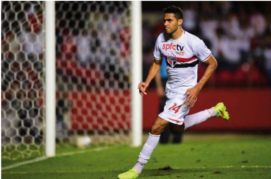
Centroavante marcou o único gol são-paulino do empate com o Criciúma, no sábado, no Morumbi

“Nós nos cobramos todos os dias, os treinamentos são pegados, com muita garra e dedicação. A cobrança maior começa aqui dentro, e o torcedor é reflexo. Temos que buscar as vitórias. A margem de pontos perdidos já extrapolou o limite que tínhamos. Temos que buscar vitórias o mais rápido possível”, cobrou, na