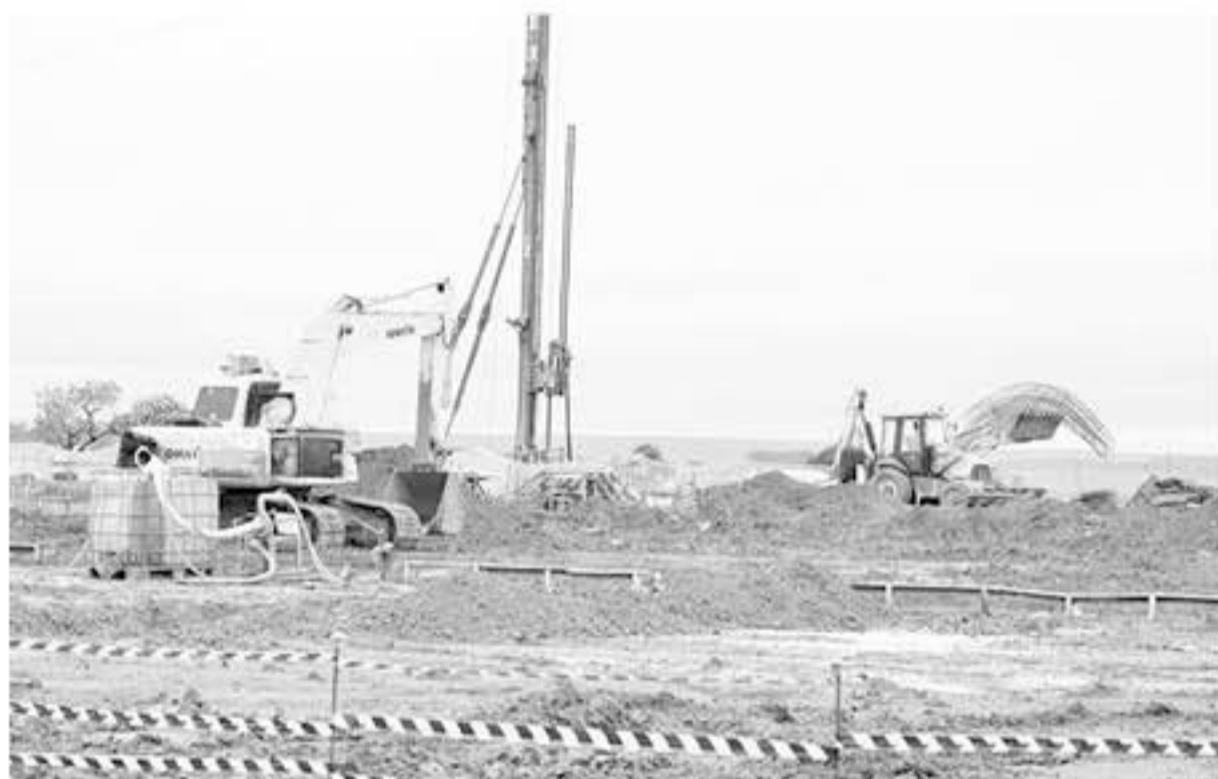
Canteiro de obras do Sistema Produtor Corumbá. Em Valparaíso, são retomadas obras do Sistema Corumbá 4.

A construção é realizada por meio de convênio entre a Companhia de Saneamento Ambiental do Distrito Fede-