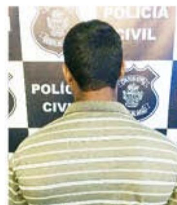
Um homem de 38 anos foi detido suspeito de estuprar uma garota de 13 anos em Itumbiara, no sul goiano. PÁG. 05

Homem é suspeito de estuprar menor que foi cuidar dos filhos dele