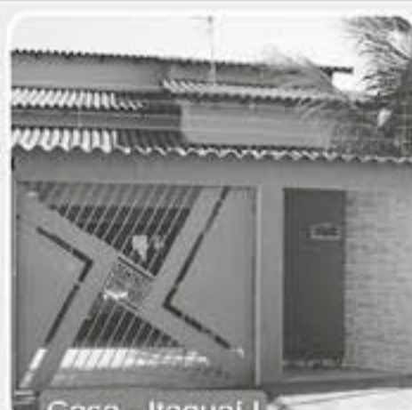
Casa - Itaguai I

Acerta Imóvel - de menor valor, carro e estudo propostas! Reservatório de água quente, garagem para 4 carros, armários embutidos da cozinha e banheiros, box nos banheiros.