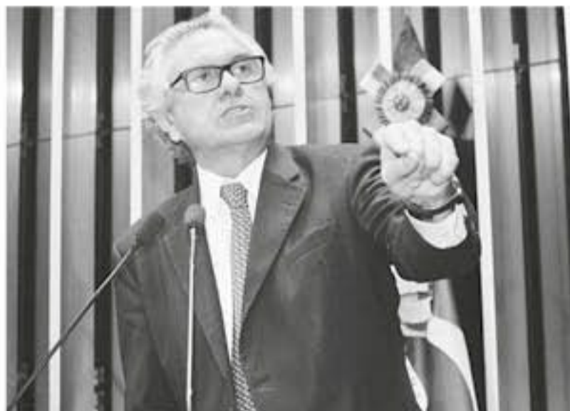
Ronaldo Caiado explicou que, por não ter dinheiro para essas despesas que estavam previstas na lei orçamentária, o governo teria se beneficiado

Segundo Caiado, o governo teria se beneficiado de empréstimos junto aos bancos oficiais para fazer pagamentos devidos