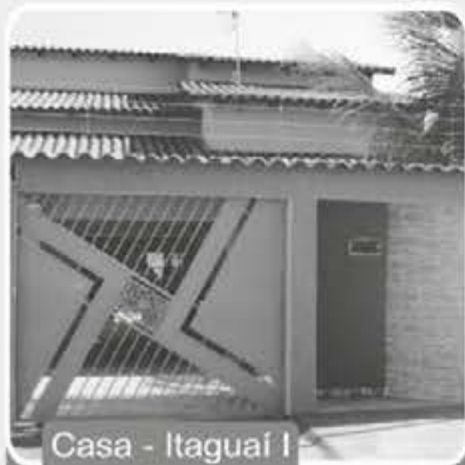
Casa - Itaguaí I

Aceita Imóvel de menor valor, carro e estudo propostas! Reservatório de água quente, garagem para 4 carros, armários embutidos da cozinha e banheiros, box nos banheiros.