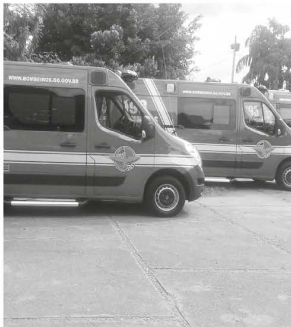
Parte dos veículos entregues na última quarta-feira, dia 29

Só no último dia 29, foram entregues 12 viaturas que passam a realizar atividades preventivas, utilizadas para a realização de vistorias de edificações e verificações de projetos; dez desencarce-