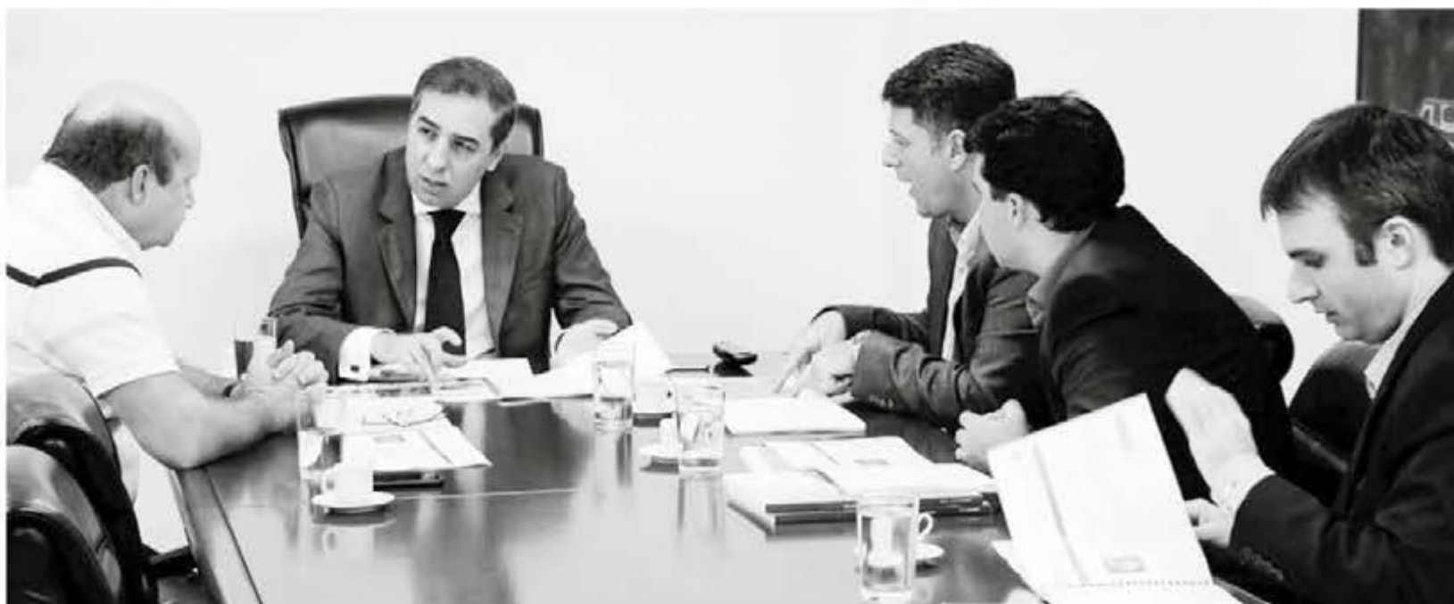
Dirigentes da empresa estiveram reunidos nesta terça-feira (05/05) com o vice-governador e secretário de Desenvolvimento Econômico, José Eliton

Os investimentos anunciados pela empresa são da ordem de R$ 50 milhões.