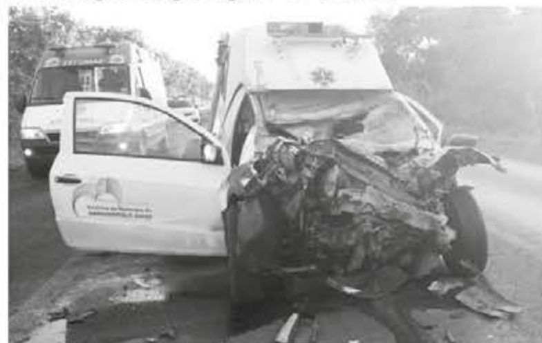
Entre os mortos estão o pai da menina, de 42 anos, e o motorista da ambulância

Entre os mortos estão o pai da menina, de 42 anos, e o motorista da ambulância, de 43 anos.