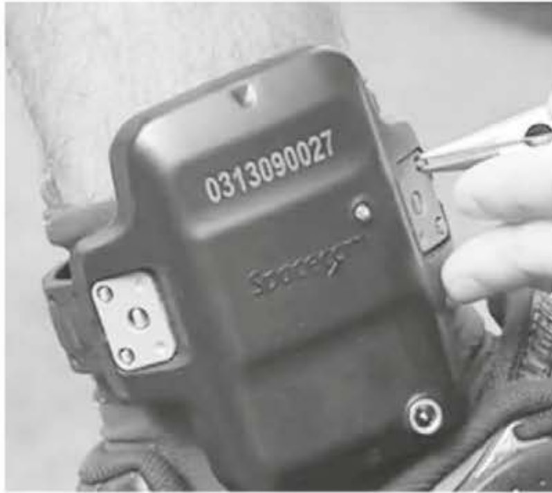
Juíza diz que tornozeleiras podem ser alternativa para detentos

A decisão de proibir que os detentos sejam levados para a CPP é da juíza Telma Apare-