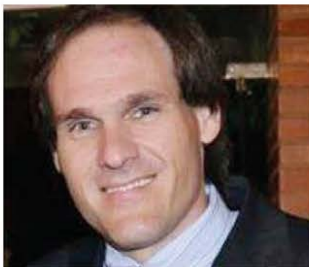
Deputado estadual Lissauer Vieira, atuante parlamentar goiano