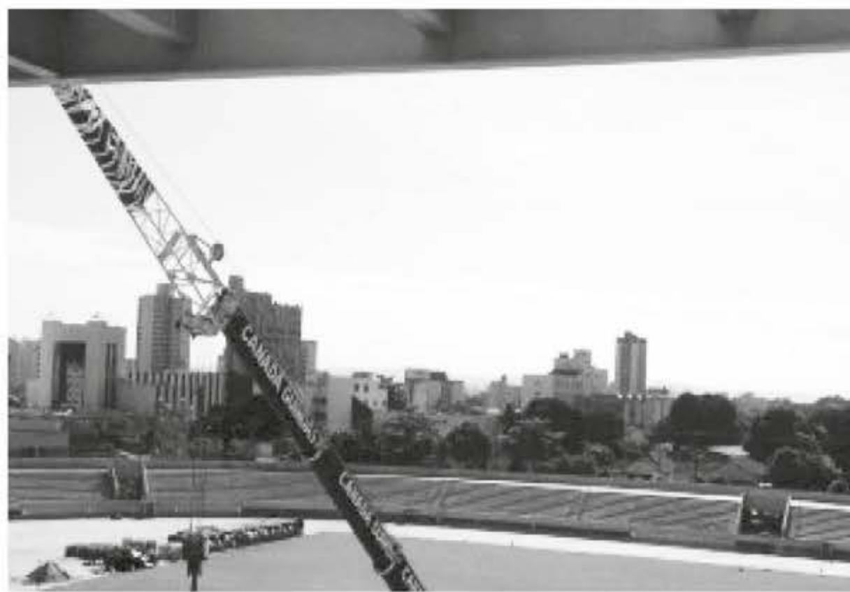
A Arena Olímpica ocupa uma área de 50 mil metros quadrados e conta com gramado de 107 por 71 metros – padrão pela Fifa

Na Segurança Pública do Estado, Marconi detalhou: "Estamos trabalhando através