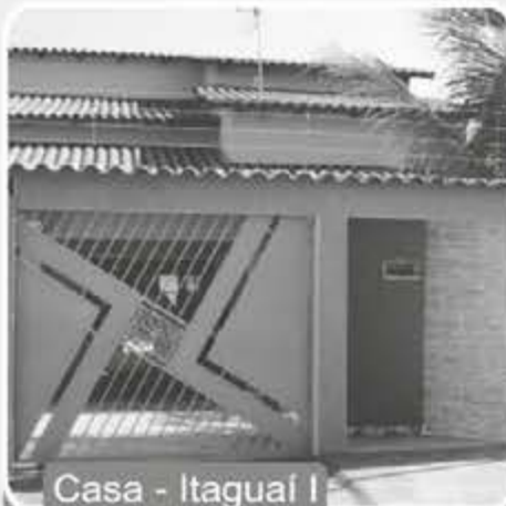
Casa - Itaguaí I

Aceita imóvel de menor valor, carro e estudo propostas! Reservatório de água quente, garagem para 4 carros, armários embutidos da cozinha e banheiros, box nos banheiros.