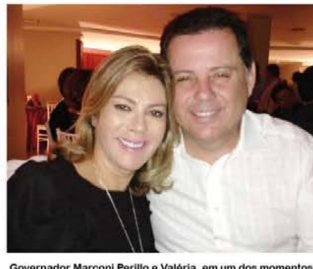
Governador Marconi Perillo e Valéria, em um dos momentos de ternura do casal