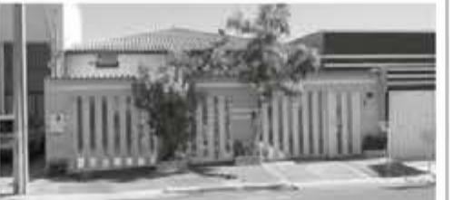
Casa de 3/4 em frente à pista de Cooper do Itanhanga I, excelente localização, pronta para morar. R$ 380 mil