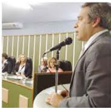
Sec. de governo Henrique Tibúrcio