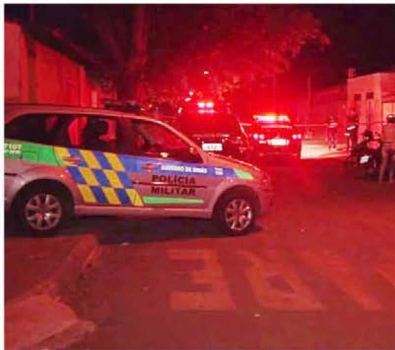
Jovem é morto a tiros na porta de casa em Goiânia

O jovem não tinha passagens pela polícia. O caso é investigado pela Delegacia Estadual de Investigações de Homicídios (DIH).