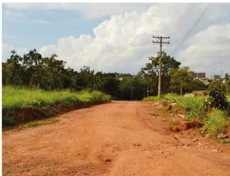
Passado quase um ano após a concretização da venda os parlamentares querem saber onde foi feito o asfalto.

Vereadores afirmam que venda de área pública não garantiu pavimentação de bairros em Caldas Novas