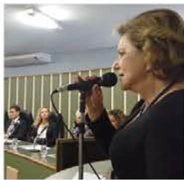
Senadora Lúcia Vânia