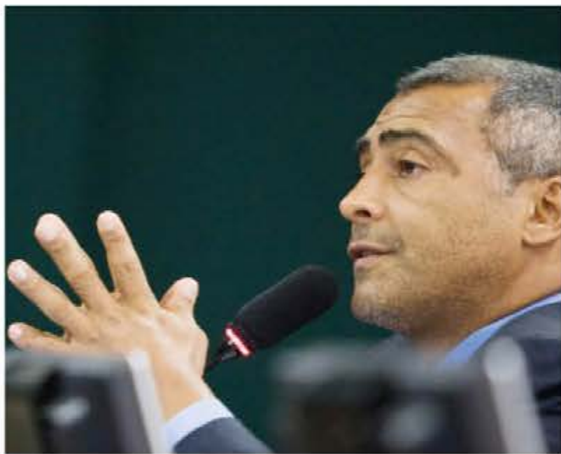
Senador Romário quer ser o relator da recém-criada CPI do Futebol

Segundo o senador, o atual presidente da CBF tem muito