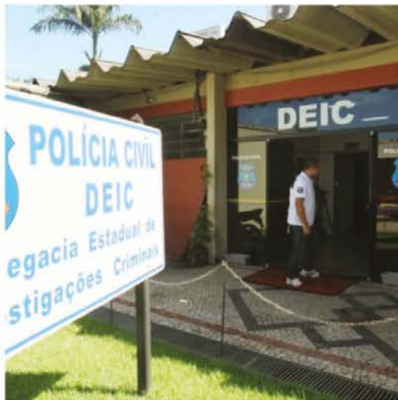
Suspeitos foram apresentados na DEIC

Após um mês de investigação do Grupo de Repressão a Roubo em Residências prende dois suspeitos