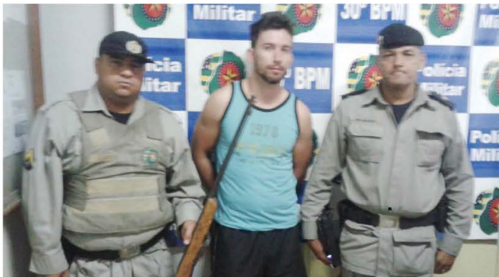
Um homem de 28 anos foi preso na Vila Pedroso suspeito de doper e estuprar duas adolescentes de 15 e 16 anos