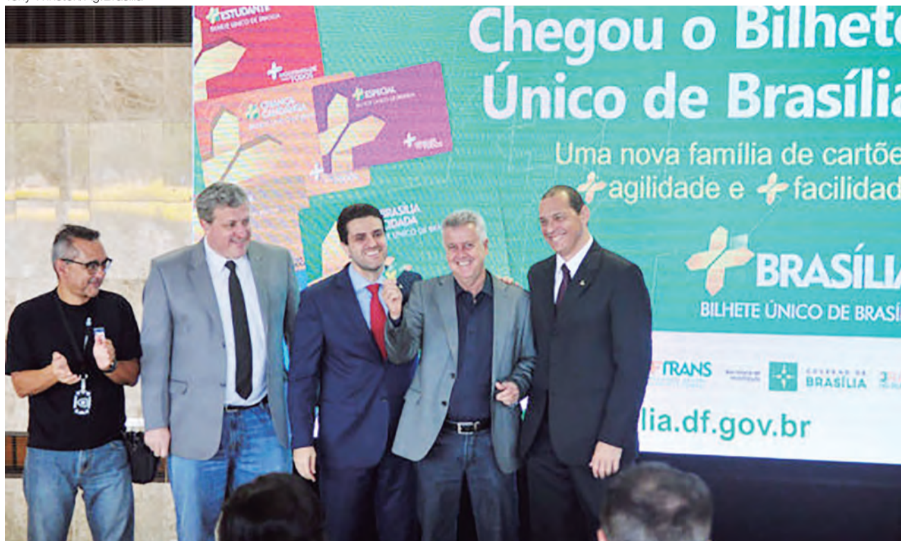
O governo de Brasília lançou, na manhã desta sexta-feira (22), o Bilhete Único e a recarga on-line de créditos para abastecer cartões do transporte público.

Com um grupo de dez cartões — quatro deles novos —, os usuários terão mais facilidades para acessar a integração do transporte público do