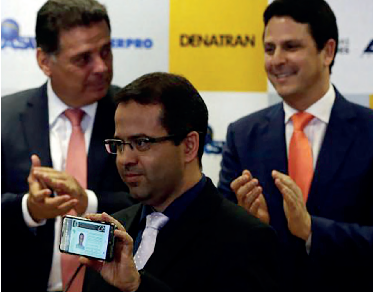
O ministro das Cidades, Bruno Araújo, participa do lançamento da Carteira Nacional de Habilitação Eletrônica

Para obter o documento virtual, é preciso baixar o aplicativo CNH-e, que está disponível nas plataformas Android, Apple ou Windows Store