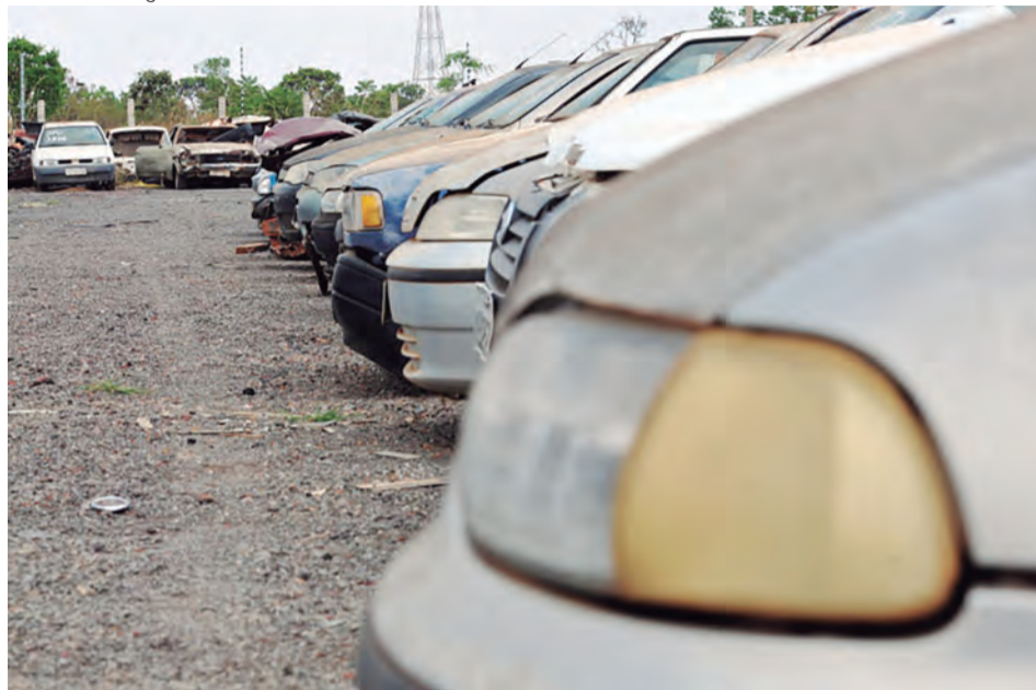
Automóveis do Detran-DF ficarão expostos para visita de 6 a 10 de novembro no pátio da Polícia Rodoviária Federal, na BR-040

Automóveis ficarão expostos para visita dos dias 6 a 10, no pátio da Polícia Rodoviária Federal, na BR-040