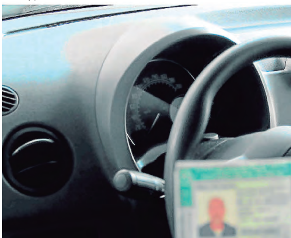
Número de autuações cresceu 136% em relação ao ano passado. Detran segue o cerco aos infratores com apoio da Polícia Civil e do Ministério Público

O Departamento de Trânsito do Distrito Federal (Detran-DF) fechou o cerco a condutores suspensos e cassados que descumprem a penalidade e insistem em dirigir. De janeiro a outubro deste ano, foram multados ao volante 956 motoristas impedidos de guiar veículos.