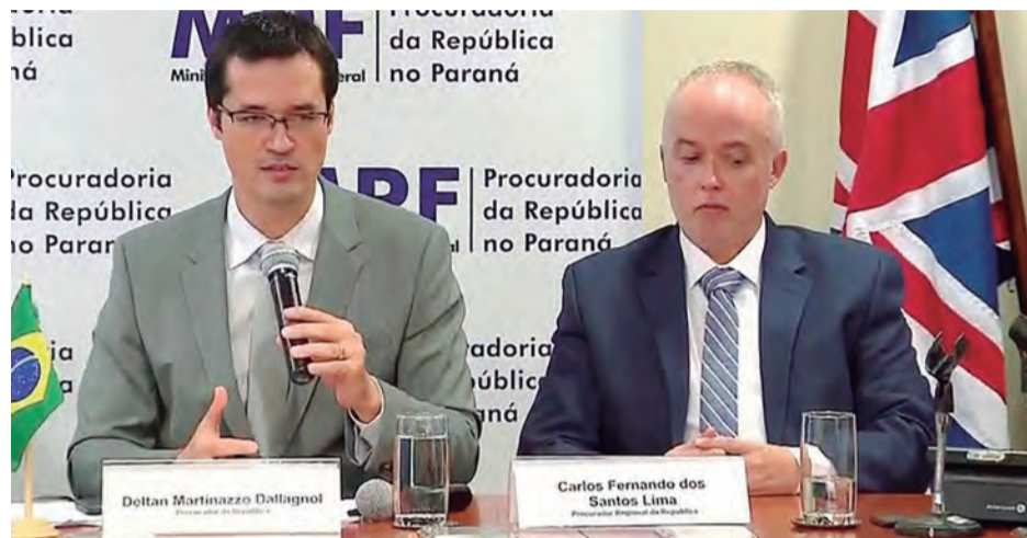
Dallagnol e Santos são atores da ficção da Car Wash

No caminho da transgressão institucional, os Procuradores que não prendem tucano demonstram por que o Ministro Dirceu não pode esperar um julgamento imparcial: