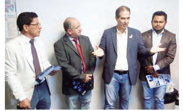
Secretário faz uma explanação dos pontos do Plano Plurianual a vereadores

A Câmara Municipal de Aparecida aprovou na sexta-feira, 27, o Plano Plurianual (PPA) 2018-2021 da Prefeitura de Aparecida, elaborado pelos técnicos da Secretaria de Transparência, Fiscalização e Controle.