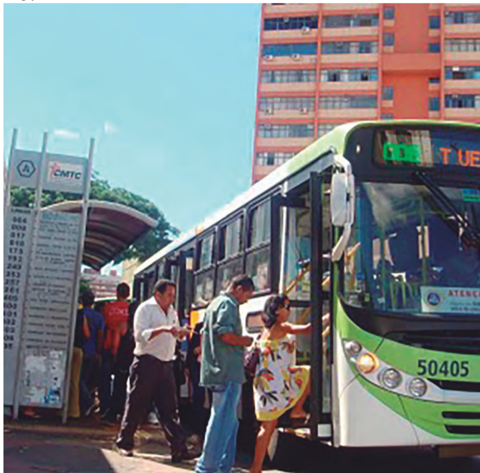
Ônibus vão circular com planilhas especiais na região metropolitana de Goiânia