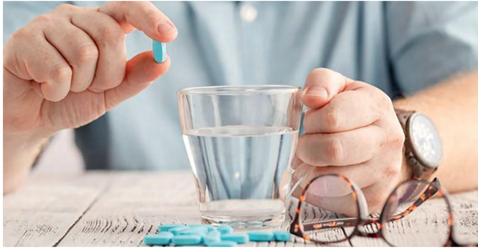
Terapia é uma das novas estratégias do país para reduzir número de infecções