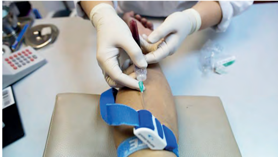
Pessoas que receberão a PrEP deverão fazer exames periodicamente

De acordo com o Ministério da Saúde, aqueles que sentem a necessidade da terapia irão passar por uma análise com profissionais da saúde, na qual serão considerados práticas sexuais, compromisso com a adesão ao medicamento e número de parceiros sexuais, entre outros fatores.