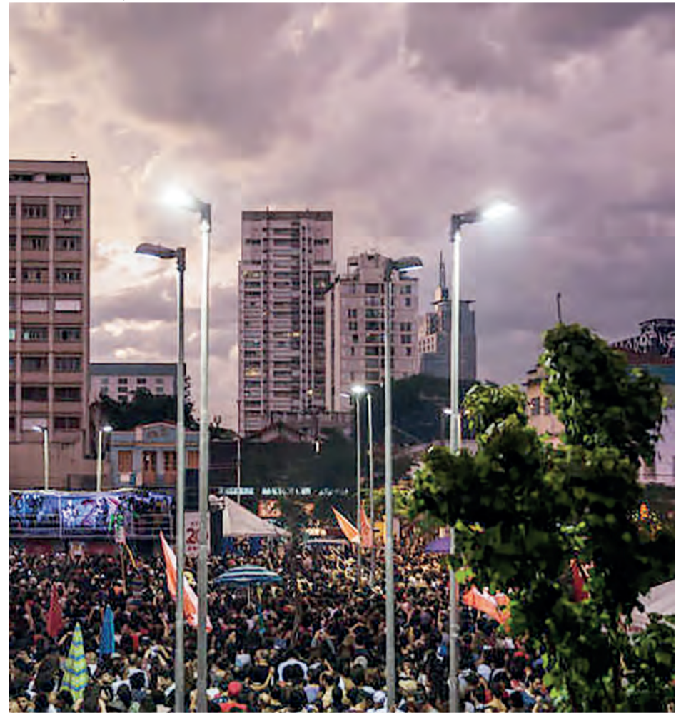
Mais de 30 mil pessoas participaram da mobilização

O show no Largo da Batata foi organizado pelo MTST, o Movimento dos Trabalhadores Sem-Teto, com participação de integrantes da Frente Povo Sem Medo - coletivo de movimentos populares, partidos de esquerda, sindicatos e ativistas independentes.