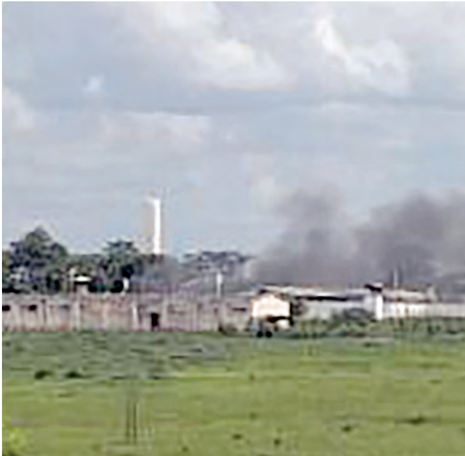
Rebelião de sexta-feira não causou mortes