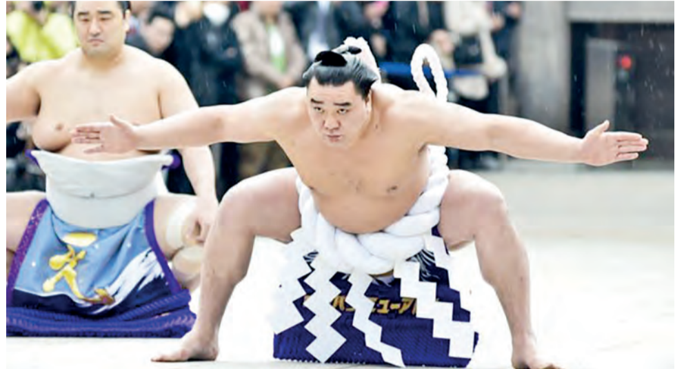
Campeão de sumô teve de se aposentar após agredir um jovem lutador em um bar