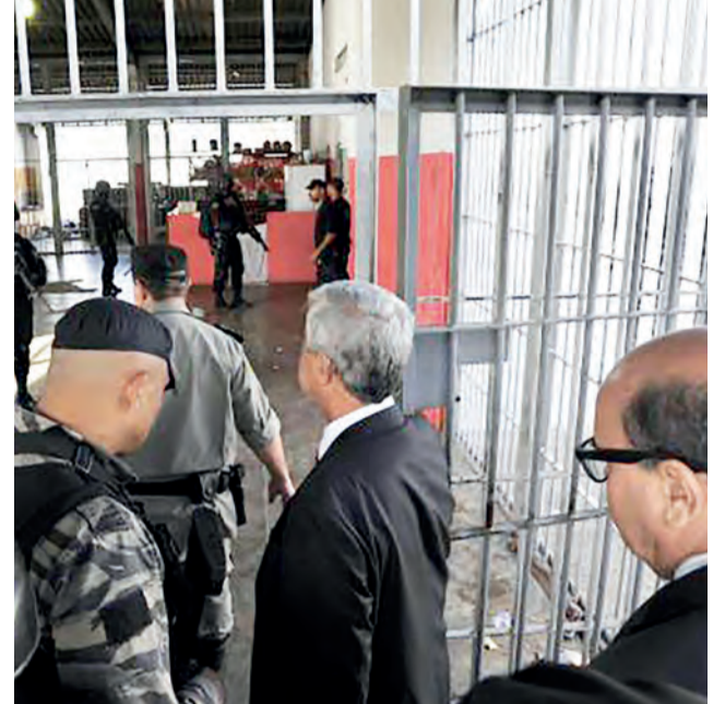
Comissão de juízes do Tribunal de Justiça de Goiás visitou Colônia Agroindustrial do Complexo Prisional de Aparecida de Goiânia na última semana

Detentos do regime semiaberto da Colônia Agroindustrial do Complexo Prisional de Aparecida de Goiânia (GO) relataram que a unidade não é controlada por agentes penitenciários, mas por presos das alas B e C, que impõem o medo aos demais internos.