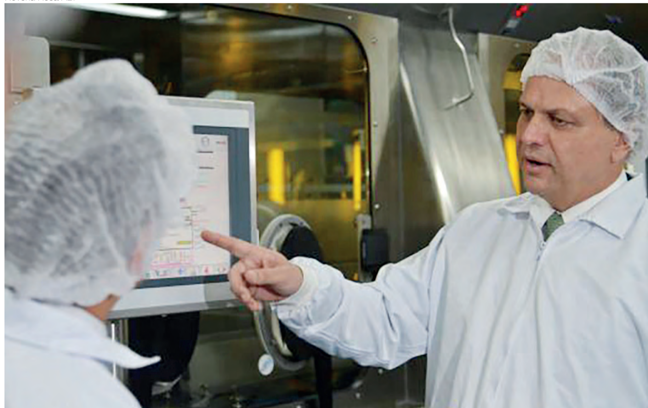
O ministro da Saúde, Ricardo Barros, participa da inauguração da linha final de produção da vacina contra febre amarela na unidade Libbs Farmacêutica

Rio já tem 131 macacos mortos em todo o estado; 69% foram vítimas de ação humana