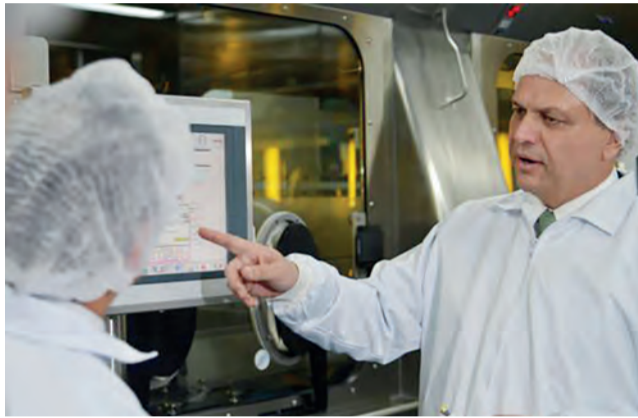
O ministro da Saúde, Ricardo Barros, participa da inauguração da linha final de produção da vacina contra febre amarela na unidade Libbs Farmacêutica