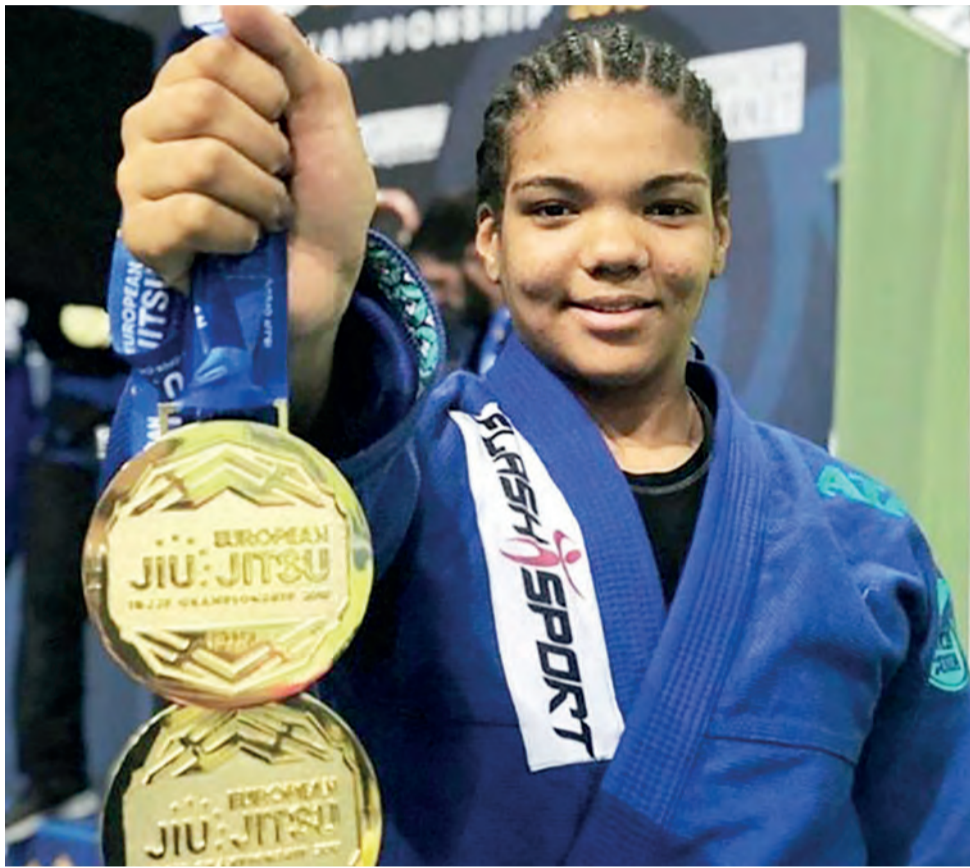
Gabi conquistou dois ouros na sua primeira competição na categoria adulta