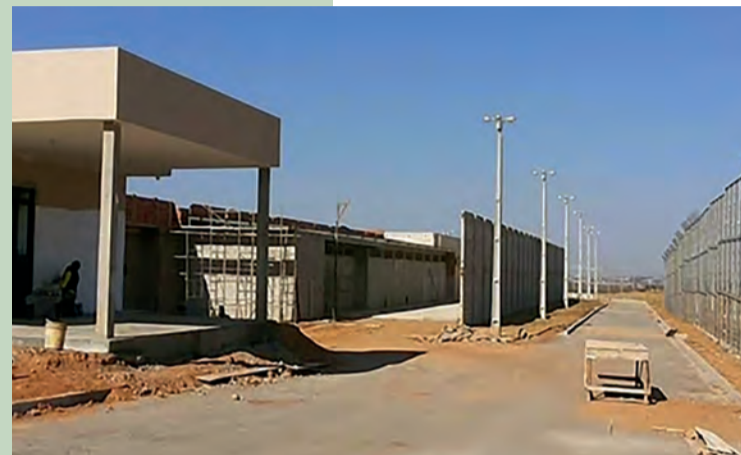
O presídio está em fase de construção final e em breve será inaugurado

Para diminuir a superlotação dos presídios do estado, o governo de Goiás está construindo em vários municípios unidades prisionais com capacidade ampla. Em Águas Lindas de Goiás, o novo presídio já está em fase final de construção, recebendo os acabamentos e em breve será inaugurado. O atual presídio de Águas Lindas de Goiás, que fica em frente à empresa Taguatur, já não suporta a demanda. A construção da nova unidade prisional poderá atender a população carcerária melhor. O governo estadual e municipal tem investido e muito na ressocialização dos detentos, dando-lhes oportunidade de, ao cumprirem suas penas, o convívio da sociedade, e para isso, são ministrado cursos, e alguns detentos também podem concluir seus estudos de acordo com a legalidade. A intenção do governo é investir mais em educação e cultura oferecendo ao jovem ampla capacidade de crescimento pessoal e profissional, além de demonstrar por meio da cultura e do esporte, maneiras de se construir uma sociedade mais igualitária e participativa afastando esse grupo de atividades ilícitas.