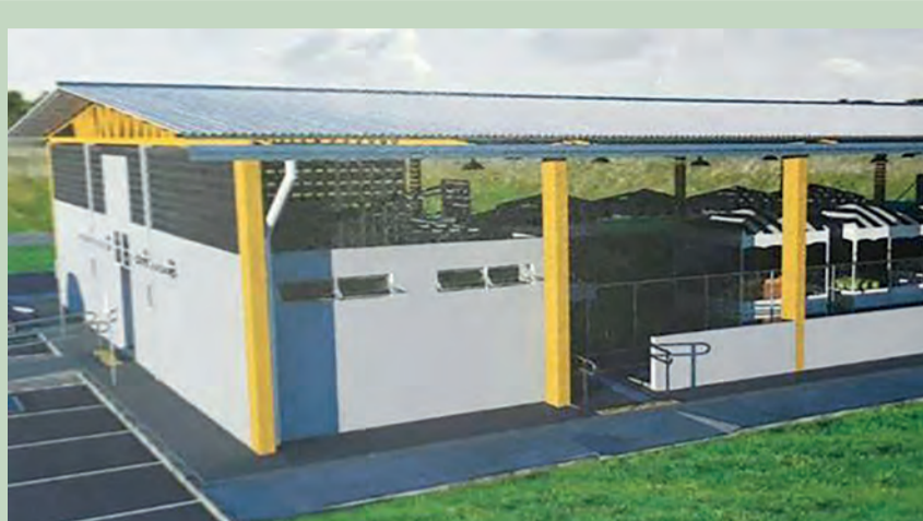
A construção do centro vai contribuir para o desenvolvimento da comunidade local

A prefeitura municipal de Santo Antônio do Descoberto, através da Secretaria de Indústria e Comércio, reivindica a construção de um centro comunitário para o município. A construção dos centros comunitários é um projeto desenvolvido pela Superintendência do Desenvolvimento do Centro-Oeste (Sudeco), que terá início ainda nos primeiros meses de 2018. Entre todos os municípios do estado, apenas dez serão contemplados, entre esses, está Santo Antônio do Descoberto. O objetivo da construção dos centros é contribuir com