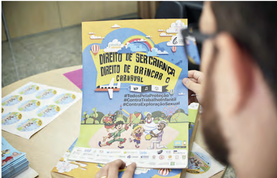
Campanha de proteção de crianças no carnaval tem o objetivo de enfrentar abuso e violação de direitos no período de festas

A equipe mobilizada pela pasta estará no bloco infantil de pré-carnaval Suvaquinho da Asa, no gramado da Funarte