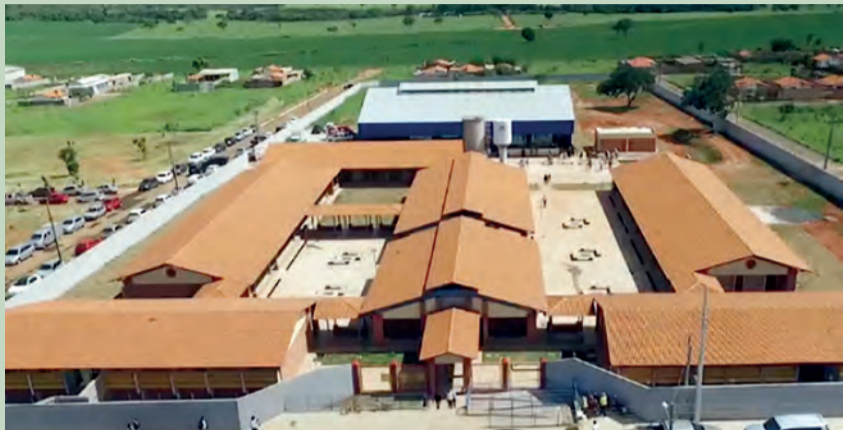
Dois escolas estaduais foram a comunidade escolar do município

Cidade Ocidental foi contemplada com duas novas escolas estaduais nos bairros Dom Bosco e São Mateus. Ambas as escolas são equipadas com 12 salas de aula, laboratórios de informática, biblioteca e quadras poliesportivas cobertas. Os prédios seguem o Padrão Século XXI, com instalações modernas e espaços de convivência concebidos pelo Governo do Estado de acordo com os melhores estabelecimentos de ensino do Brasil. O governador Perillo enfatizou que educação, cultura e conhecimento formam o