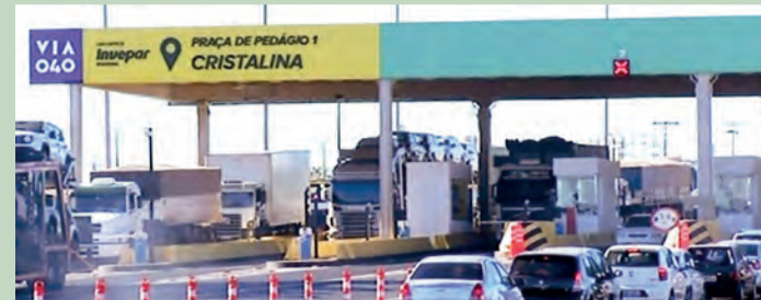
Os pedágios estão próximas do perímetro urbano da cidade

O município de Cristalina possui dois pedágios para motoristas, sendo um na BR-040 e outro na BR-050. As empresas que controlam os espaços, segundo a Prefeitura da cidade, pagou de impostos aos cofres públicos, através do imposto municipal, Imposto Sobre Serviços de Qualquer Natureza (IS-SQN), a quantia de R$ 2 milhões. De acordo com a prefeitura, esse valor corresponde ao maior número de recursos recebidos por um município em relação ao pagamento desse imposto. Uma séria batalha judicial foi travada com as empresas responsáveis pela manutenção do pedágio para que elas tomassem providências no sentido de parar de contornar as exigências estipuladas pelo poder público local. O prefeito explica que as praças de pedágios estão muito próximas do perímetro urbano da cidade. Segundo o governo municipal, a intenção da atual gestão é fazer com que as empresas construam as