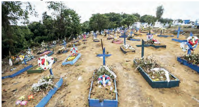
Enterro de vítimas assassinadas no Complexo Penitenciário Anísio Jobim, em Manaus, no ano passado; capital amazonense é uma das citadas em relatório de violência urbana

o continente com o maior número de cidades violentas do mundo: das 50 listadas no ranking, apenas oito não são latino-americanas. Doze das cidades estão no México, país que vive anos de enfrentamentos entre cartéis de drogas e forças de segurança.