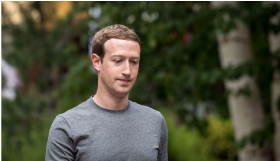
Legisladores do Reino Unido e dos Estados Unidos querem chamar o fundador da rede, Mark Zuckerberg, para depor

BBC - A empresa teria tido acesso ao volume de dados ao lançar um aplicativo de teste psicológico na rede social. Aqueles usuários do Facebook que participaram do teste acabaram por entregar à Cambridge Analytica não apenas suas informações, mas os dados referentes aos amigos do perfil.