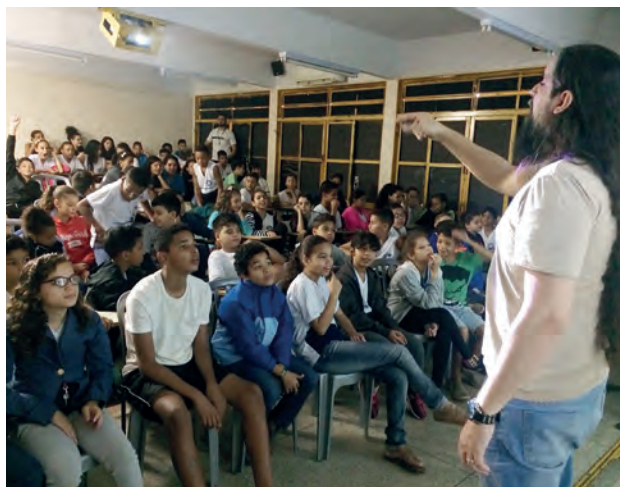
Escola Municipal Parque São Jorge

trado e de doutorado em Ciências Biológicas, com especialização em anfíbios.