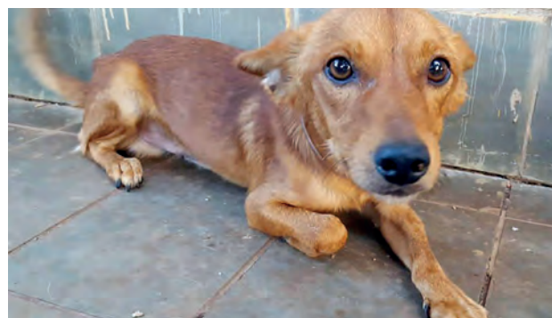
A empresa também está realizando uma campanha de ração solidária para ajudar os animais da ONG

rão disponibilizados filhotes e adultos, em sua maioria sem raça definida, todos castrados, vacinados e vermifugados. Os interessados em adotar um dos animais deverão pagar uma taxa de R$ 30,00, que será destinada a construção da nova sede da ONG. Além disso, os adotantes passarão por uma triagem, entrevista e precisarão preencher uma ficha e um termo de adoção. É necessário apresentar