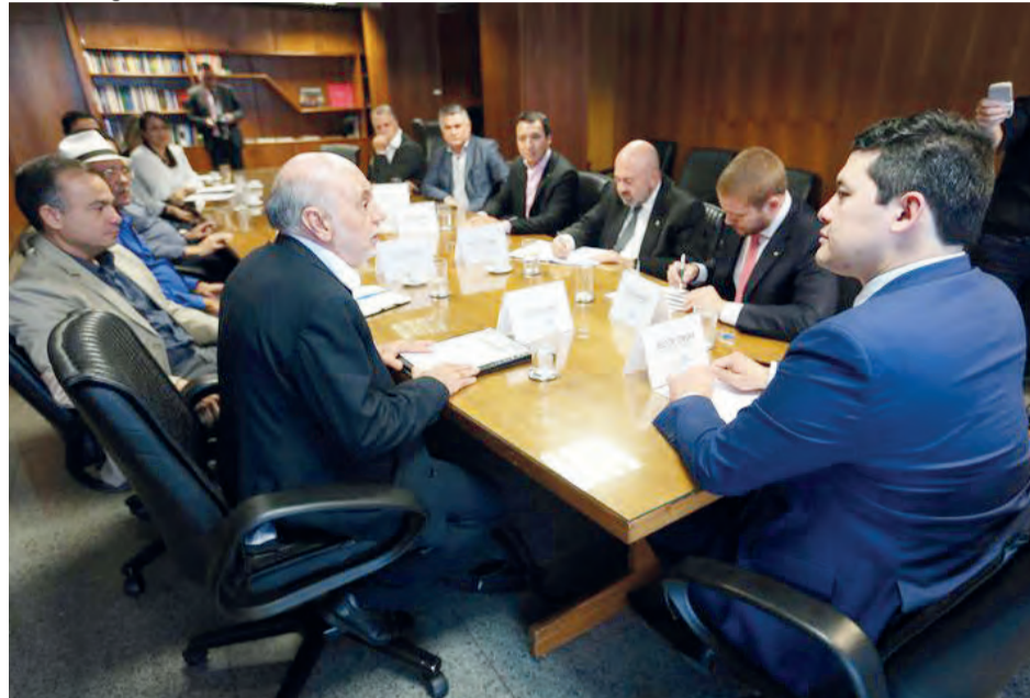
Ministro do Trabalho, Helton Yomura, reúne-se dirigentes do setor de produção de alimentos

No dia 18 de abril, a UE anunciou que vai descredenciar 20 plantas exportadoras da lista de empresas brasileiras autorizadas