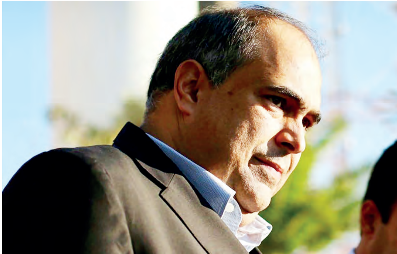
Sampaio vê na greve a luta dos caminhoneiros em defesa do interesse de todos os brasileiros

Democrata Cristão prega redução de ICMS sobre combustíveis, telefonia e energia elétrica