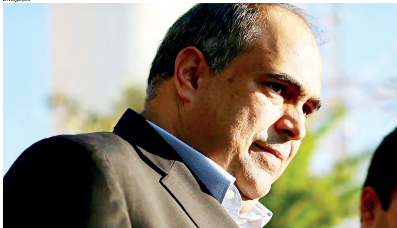
Sampaio vê na greve a luta dos caminhoneiros em defesa do interesse de todos os brasileiros