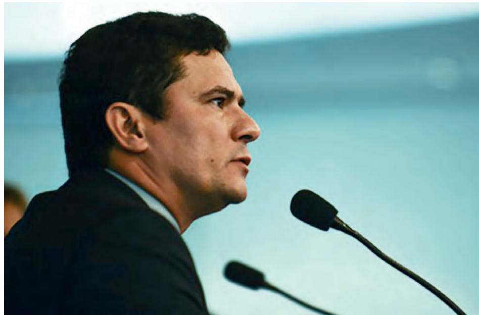
Juiz da Lava Jato declinou de competência sobre corrupção em pedágios no Paraná