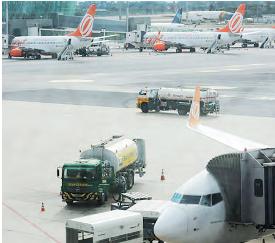
A fim de aumentar o número de partidas internacionais e fortalecer Brasília como centro de conexões, o Distrito Federal vai oferecer imposto menor em querosene de aviação a companhias que tiverem uma frequência mínima de voos na cidade

■ 7%: quando tiver 28 ou mais frequências de