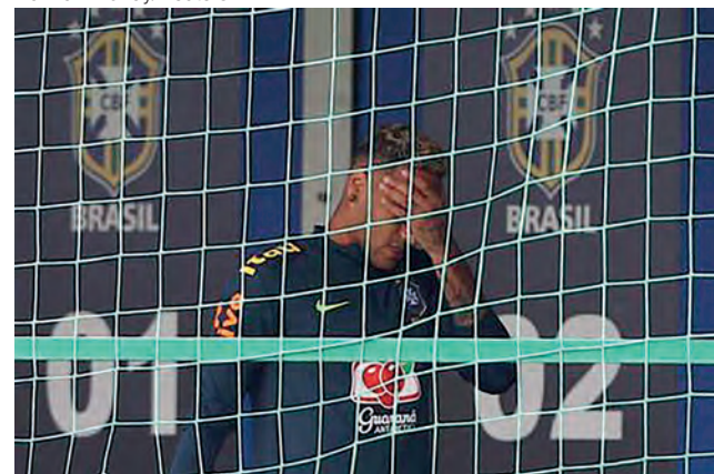
Neymar saiu desolado do treino da seleção

Atacante entrou feliz em campo, mas sentiu desconforto e deixou a atividade antes do grupo. Incômodo é no mesmo pé da cirurgia.