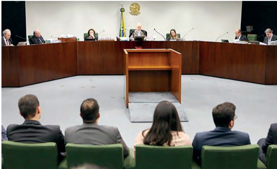
Segunda Turma do STF tem viés considerado mais garantista

Mais uma vez a tentativa do ex-presidente Luiz Inácio Lula da Silva obter sua liberdade saiu das mãos da Segunda Turma do Supremo Tribunal Federal