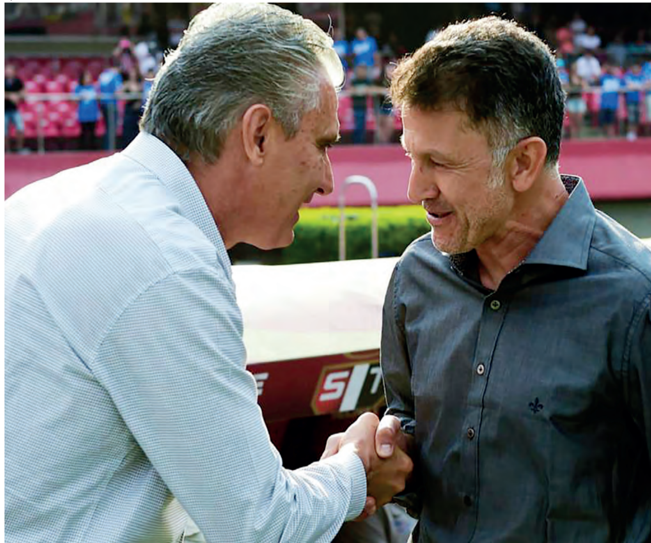
Juan Carlos Osorio e Tite se enfrentaram em 2015

Os dois se enfrentaram na 17ª rodada do Brasileirão de 2015, quando o São Paulo, dirigido pelo colombiano, e o Corinthians, do atual treinador da Seleção, empataram por 1 a 1, no Morumbi