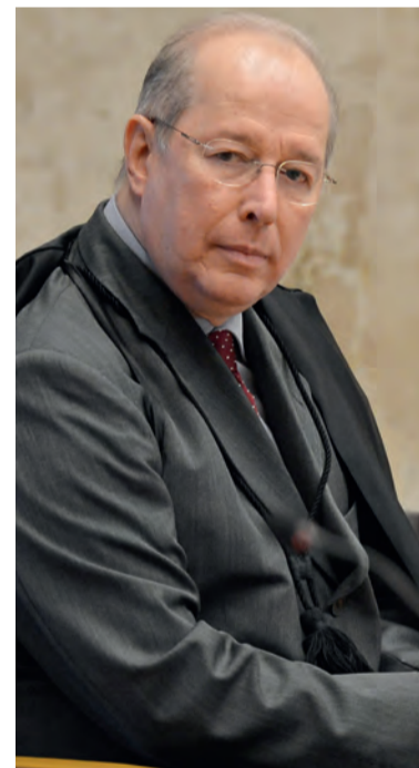
Celso de Mello, o decano