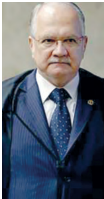
Edson Fachin, o relator