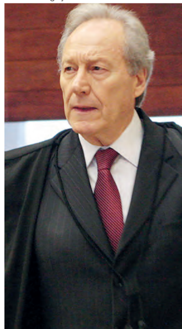
Ricardo Lewandowski, presidente