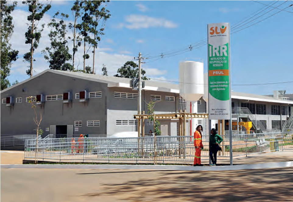
Com capacidade para processar 32 toneladas de materiais recicláveis por dia, foi entregue nesta terça-feira (3) a primeira Instalação de Recuperação de Resíduos de Brasília

dores atuavam no lixão da Estrutural, debaixo de sol e de chuva, ao lado de tratores e de caminhões, correndo risco de acidentes. Esta instalação significa uma transformação na vida dessas pessoas”, disse o governador de Brasília, Rodrigo Rollemberg, durante a cerimônia desta manhã.