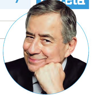
■ Paulo Henrique Amorim f @Conversa.Afiada.Oficial t @ConversaAfiada