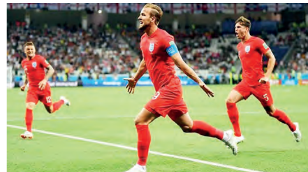
A Inglaterra conta com o artilheiro da Copa para vencer a Colômbia

Inglaterra elimina Colômbia nos pênaltis e enfrenta Suécia