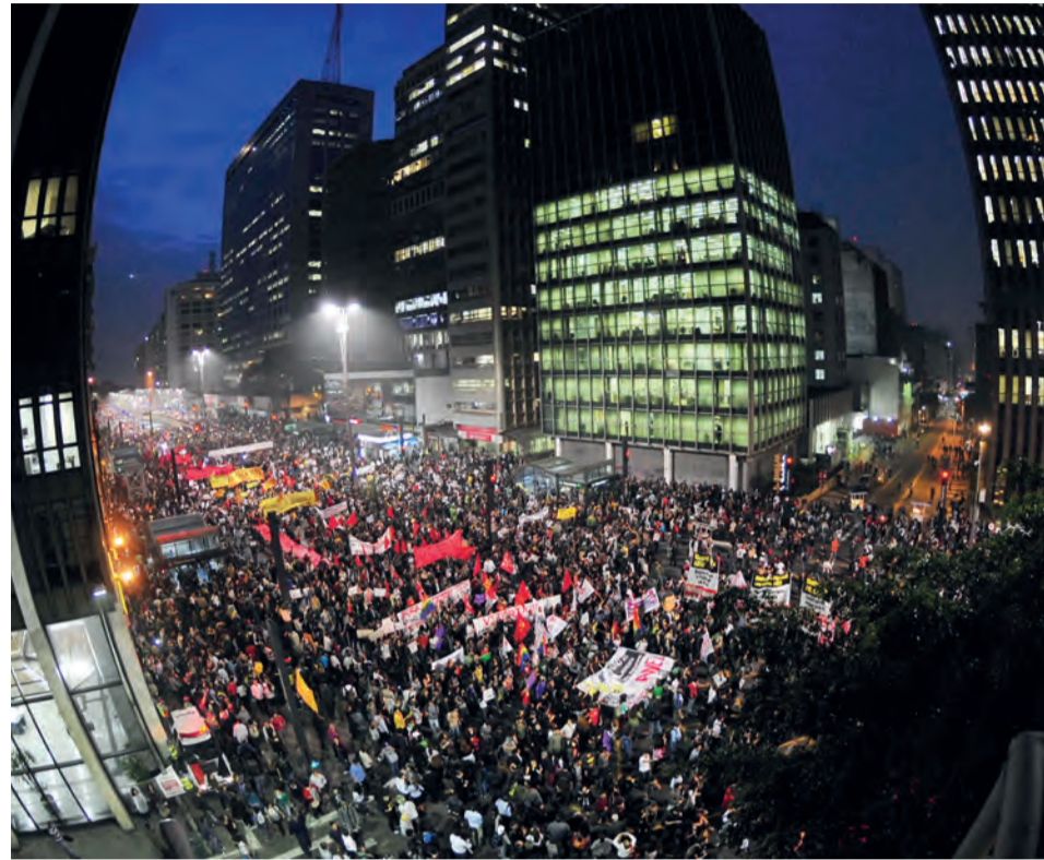
Crise de representatividade foi bandeira dos protestos de junho de 2013

Os jovens que participaram em 2013 e 2014 dos protestos contra a realização da Copa do Mundo, alegando que se tratavam de obras superfaturadas, gerando gastos desnecessários ao país, foram condenados, ontem (terça, 17), pelo juiz Flavio Itabaiana, da 27ª Vara Criminal do Tribunal de Justiça (TJ), a sete anos de prisão. Eles poderão recorrer da decisão em liberdade.