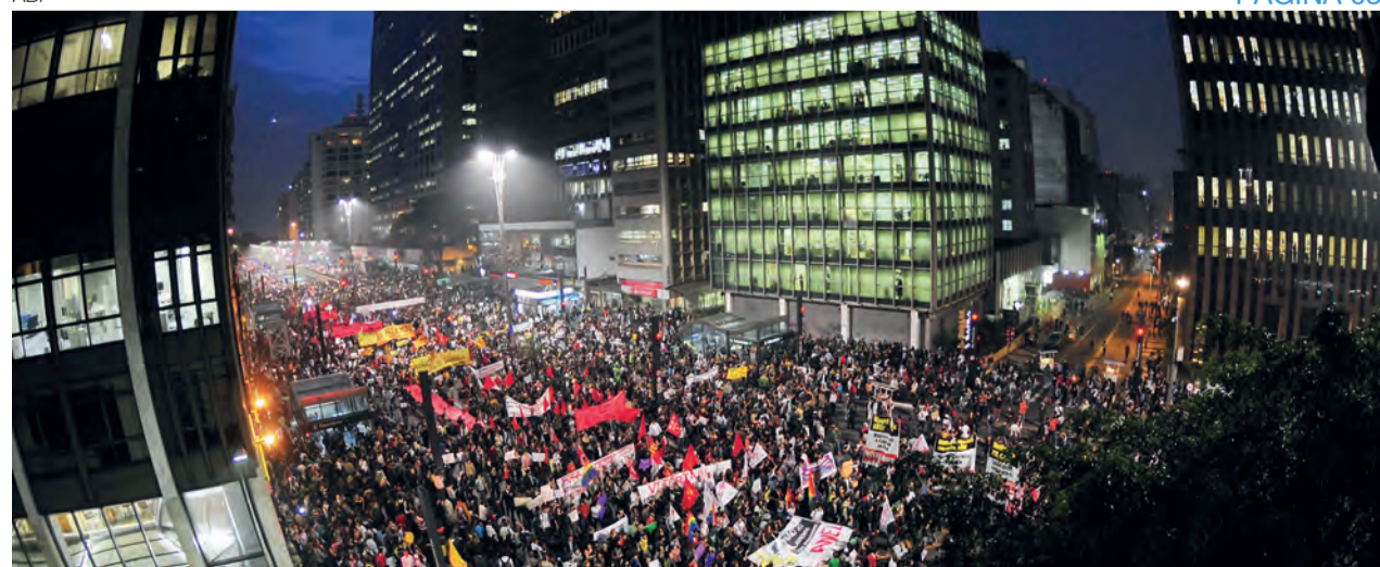
Crise de representatividade foi bandeira dos protestos de junho de 2013