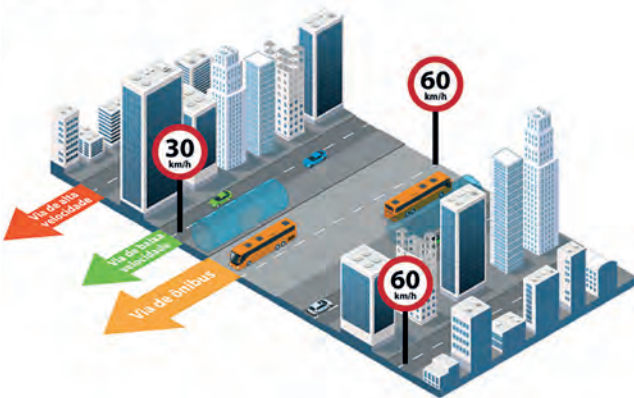
Sistema de transporte público de Curitiba

gação espacial, em que a oferta de empregos e o acesso ao transporte continua priorizando as regiões centrais. “O ponto curioso de Curitiba é que quando você olha a desigualdade entre as pessoas ricas e pobres, é uma das maiores desigualdades do Brasil [no deslocamento casa/trabalho]. Brasília e Curitiba são as duas cidades onde o tempo que a pessoa pobre gasta no trânsito é bem maior do que o da pessoa rica”, aponta.