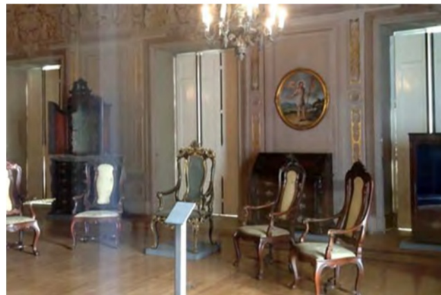
Salão do Museu Nacional, da época em que abrigava a família imperial brasileira: 'Eu estou escrevendo sobre os espaços onde dom Pedro 2º viveu e não tenho mais o espaço disponível, ele não pode mais ser visto', lamenta historiador Rezzutti