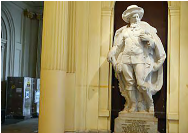
Projeto inclui o restauro e recuperação de tudo que estiver deteriorado e em mau estado de conservação