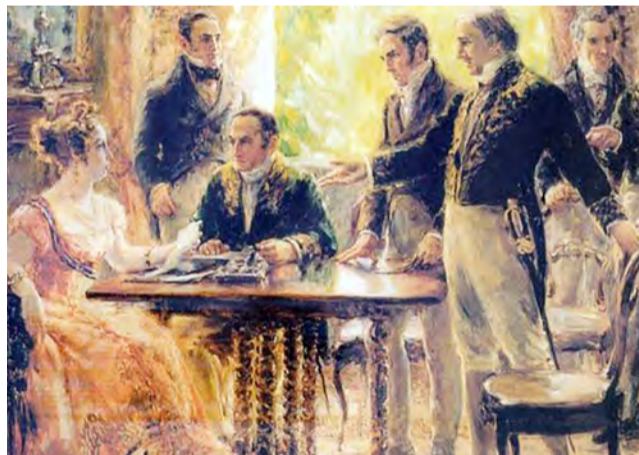
Maria Leopoldina presidiu uma reunião do Conselho do Estado que resultou em uma recomendação: que o príncipe declarasse o Brasil independente PINTURA DE GEORGINA DE ALBUQUERQUE (1922)