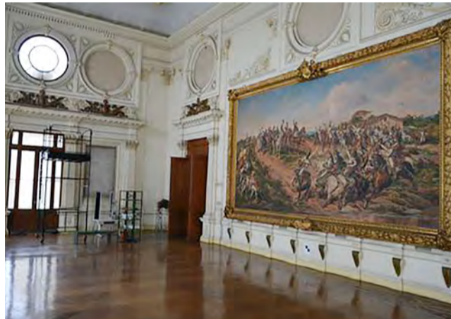
O Museu Paulista, também conhecido como Museu do Ipiranga, está fechado desde 2013