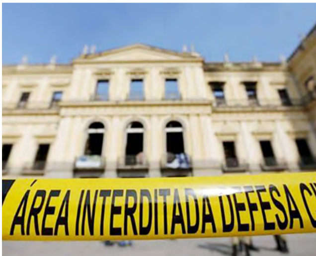
Museu Nacional ainda mensura os danos causados pelo incêndio a seu acervo