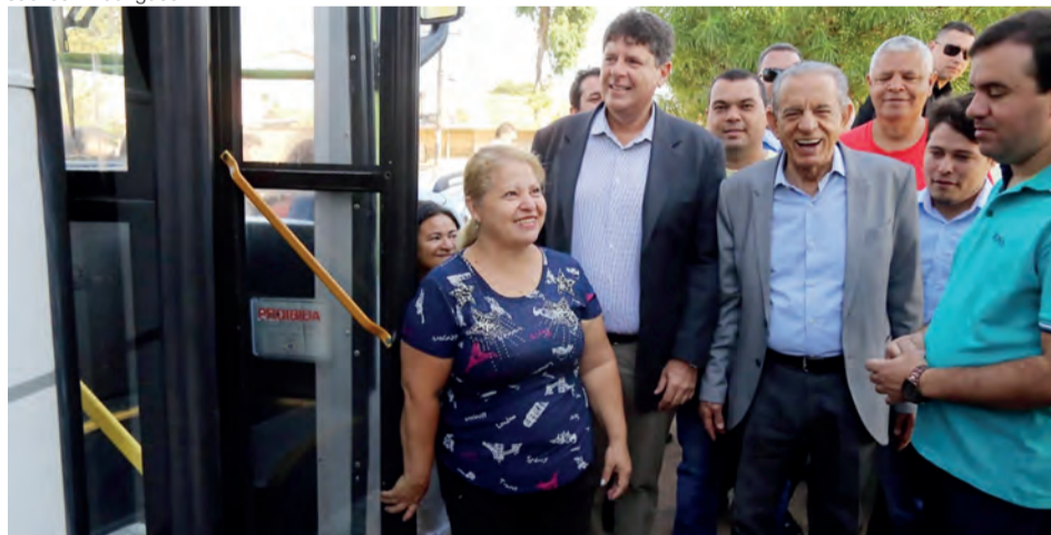
Apresentação do novo itinerário, que vai passar pelo Cais Novo Mundo e Paço Municipal, ocorrerá nesta quarta-feira, 19, e contará com a presença do prefeito Iris Rezende

Com 34 quilômetros de extensão, a nova linha vai ligar as regiões Sudeste e Leste sem a necessidade de integração no Terminal da Bíblia. Esta será a terceira linha lançada em setembro pela Prefeitura de Goiânia. A primeira foi a 933, que ligou a região Noroeste