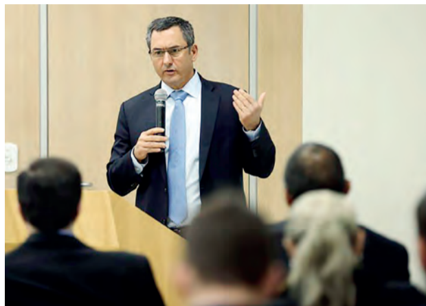
Ministro da Fazenda, Eduardo Guardia, participa do seminário Agenda de Governo no Setor de Energia na Esaf

Como uma alternativa, Guardia propôs dar mais competição ao setor do refino, com mais liberdade de preços, e adotar um tributo como proteção, para absorver as variações do preço do petróleo no mer-