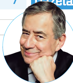
■ Paulo Henrique Amorim f @Conversa.Afiada.Oficial t @ConversaAfiada