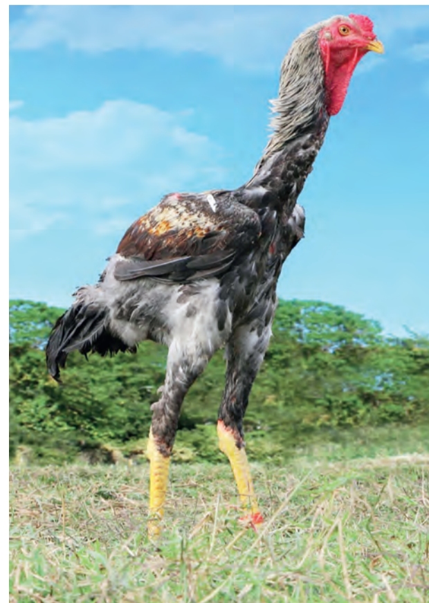
Voodoo da Diamante, galo de maior comprimento no mundo, com 126 cm

Genunamente brasileiro, o Índio Gigante nasceu em Goiás e Minas Gerais, do cruza-