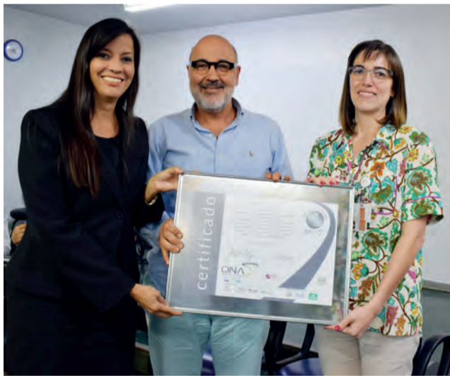
Diretoria ISG-HDT com Certificado ONA 2

A mudança de nível de acreditação do hospital foi confirmada após duas auditorias realizadas por avaliadoras do IBES, uma nos dias 22 e 23 de maio e, a segunda, em 26 de setembro. Durante as visitas, os auditores avaliaram os processos de trabalho, estrutura física, sanitária, qualidade de