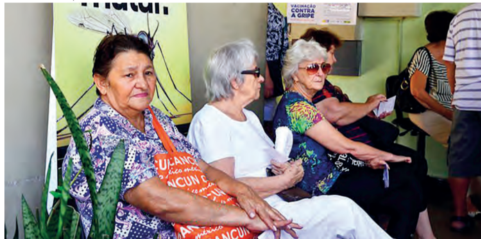
Vacinação é a estratégia mais eficiente para prevenir doenças infecciosas e evitar o aumento da vulnerabilidade entre idosos

Se pararmos de vacinar, doenças voltarão mais fortes, diz ministério