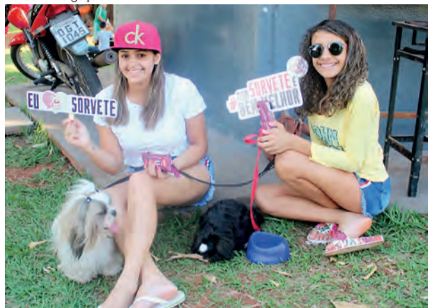
Crianças serão presenteadas com picolés em dois parques de Goiânia