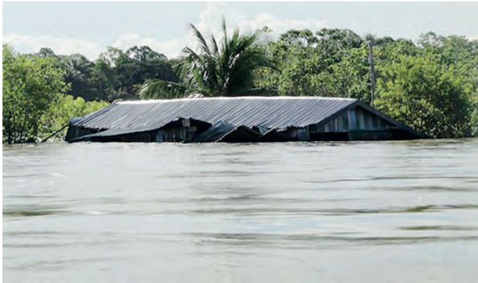
Aquecimento global e gases estufa têm efeitos diretos e indiretos sobre as chuvas amazônicas, que incluem até um ‘portal entre os oceanos Atlântico e Índico’

tação seca está se tornando mais seca e a estação chuvosa, mais chuvosa. Mas por quê?