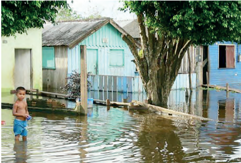
No início do século 20, cheias extremas do Amazonas ocorriam a cada 20 anos; hoje, acontecem a cada quatro