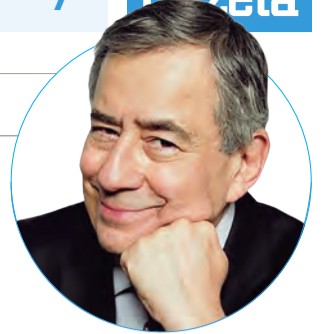
■ Paulo Henrique Amorim f @Conversa.Afiada.Oficial t @ConversaAfiada