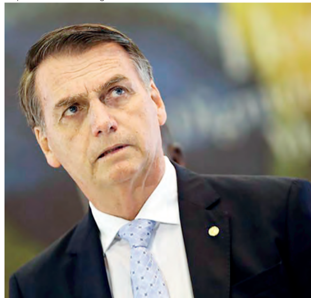
Bolsonaro receberá carta de prefeitos que reafirmam apoio às reformas estruturais

Eles pedem ainda a retomada do suporte financeiro para projetos de