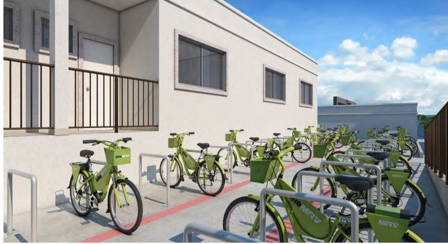
Projeção artística do bicicletário do condomínio Arcos da Serra