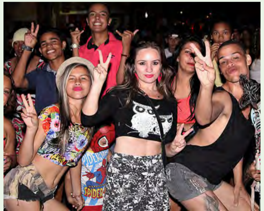
Do tradicional ao original, os grupos de foliões vão animar o carnaval da cidade