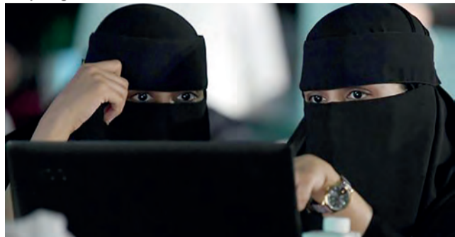
A Arábia Saudita, cuja legislação é notoriamente repressiva em relação às mulheres, ocupa a última posição da lista, com uma pontuação de 25,6%