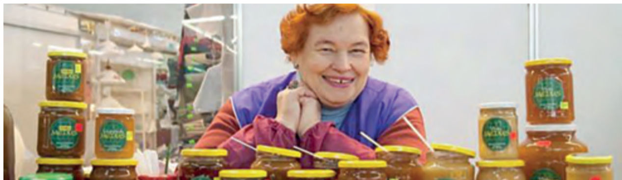
A Letônia é um dos seis países que têm igualdade de direitos econômicos entre homens e mulheres

DA REDAÇÃO COM BBC - A instituição diz que só há "paridade total" em 6 das 187 nações analisadas em sua nova pesquisa, intitulada Mulheres, Negócios e a Lei.