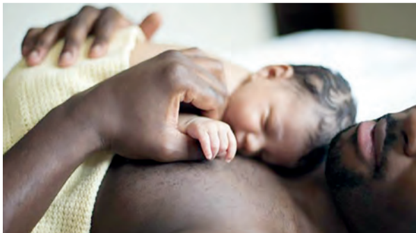
33 países de todas as regiões começaram a ter licença-paternidade e 47 passaram leis ligadas à violência doméstica.