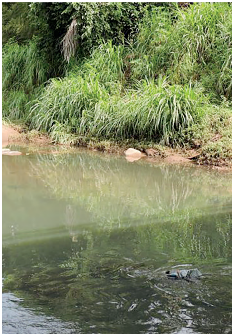
Inspeção da Catep do MP em 2018 flagra despejo de esgoto no Córrego Anicuns