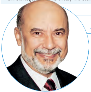
■ Paiva Netto