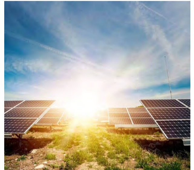
Painéis de energia solar: Imagem ilustrativa

“Basta ter espaço em telhado ou terreno para